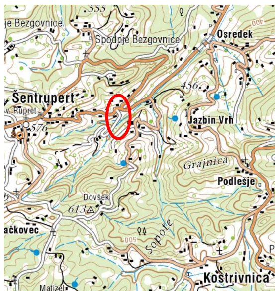
Slika 2: širši prikaz v prostoru – topografija