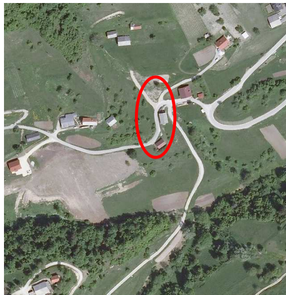
Slika 3: širši prikaz v prostoru – digitalni ortofoto posnetek