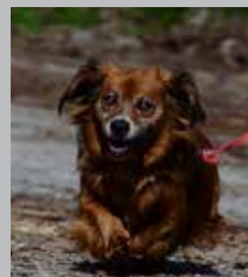
Prijazen kuža je cepljen in kastriran, star 8 let.