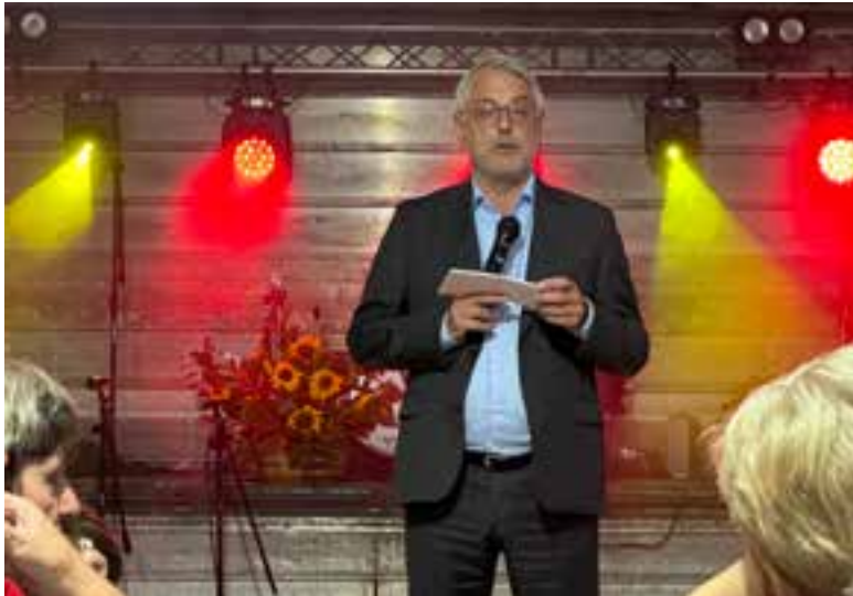
Zbrane je nagovoril minister Matjaž Han

Vsako leto je avgust tisti mesec, ko našo krajevno skupnost preplavijo dogodki, namenjeni prav vsem našim krajanom in ga zaključimo z osrednjo prireditvijo, ko še posebej slavimo krajevni praznik . Za dogajanje že vrsto let skrbijo aktivna društva v kraju, ki prirejajo aktivnosti in dogodke, ki so namenjeni prav vsem. Najprej so za naše najmlajše poskrbeli člani Društva mladih Jurklošter s Poletnim prepletom, sledila je športno obarvana sobota, dopoldan Orionov pohod pod okriljem KS Jurklošter, v sodelovanju z Zavodom Odon in STIK-om Laško in v popoldansko večernih urah 29. tradicionalni turnir v malem nogometu. To leto so se člani Športnega društva Jurklošter še posebej potrudili, saj so praznovali že 30 let delovanja. Soboto so dodatno obarvali še člani Likovnega društva Laško in člani skupine KULL. Prvi so v prostorih in na dvorišču kartuzijske ustvarjali na temo »Po Orionovi poti, po poti starodavnih civilizacij in spomenik ljubezni med Veroniko in Friderikom II. Celjskim«, drugi pa so pripravili dela na tematiko »V kamen in les zapisana preteklost«. Nastopila je zadnja avgustovska sobota in osrednja prireditev, ki sta jo spremljali še otvoritvi na novo asfaltiranih krajevnih cest Voluš–Zelenjak in Lahov Gra-