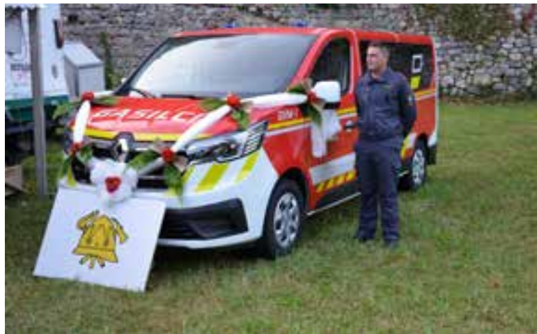
Novo gasilsko vozilo GVM

Jurklošter je ponovno zaživel v prazničnem vzdušju ob krajevnem prazniku, ki ga je popestrila tradicionalna gasilska veselica. Ob tej priložnosti je PGD Jurklošter prevzelo dve novi vozili, in sicer GVM in novo nadgradnjo na vozilu VGV.