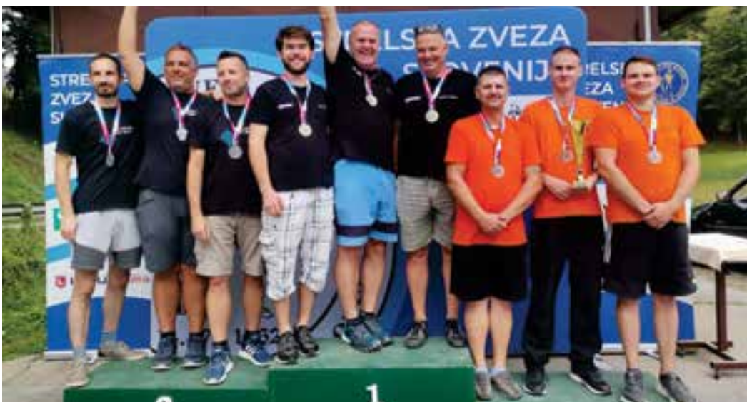
Strelsko društvo Dušan Poženel Rečica - državni prvak