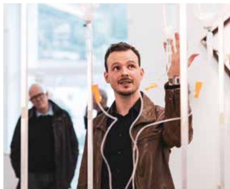
Umetnik predstavlja svoje diplomsko delo

O svojem diplomskem delu, umetnik navaja: »Delo se lahko pojmuje kot reprezentacijo in sleherni živ sistem, kateremu je dan čas in lasten ritem. Slednji mu omogoča, narekuje in determinira življenje, smrt je neizogibna, gledalcu pa je dan ta vpogled kot izsek v spominu časa.«