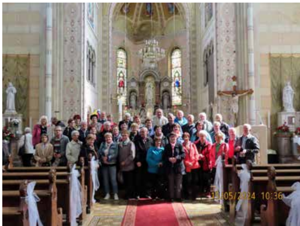
V baziliki v Brestanici

V aprilu se je skupina izletnikov odpravila na tridnevno romanje v Međugorje. Poleg ogleda tega znanega romarskega mesta so si naši člani ogledali starodavno mesto Mostar ter naravno znamenitost slap Kravice. Prepričani smo, da so vsi udeleženci tega s sabo odnesli lepe spomine.