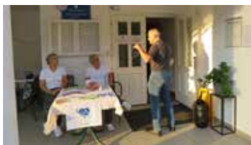
Na krvodajalski akciji so prvič sodelovali tudi iz Centra za krepitev zdravja ZD Laško

in vsako leto za vse krvodajalce pripravijo brezplačni srečelov z darili, ki jih prispevajo številna podjetja. Zanje so vsem donatorjem še posebej hvaležni. Letos pa je bila na akciji še ena popestritev, in sicer so z nami sodelovali in predstavljali svojo dejavnost strokovnjaki iz Centra za krepitev zdravja Zdravstvenega doma Laško. Veseli in hvaležni smo, ker se je akcije udeležilo 52 krvodajalcev.