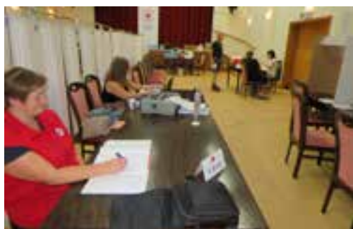
Dvorana Sindikalnega doma za en dan v drugačni podobi

Kljub nekaterim pomislekom glede možnosti izvedbe, smo jo ob razumevanju vodstva Krajevne skupnosti Rečica in najemnikov gostinskega lokala uspešno izpeljali, za kar se obema iskreno zahvaljujemo. Krvodajalsko akcijo v Rečici smo po trinajstih letih premora znova vpeljali pred 21 leti in je v zadnjih letih, ali kar desetletju, pridobila še posebno mesto, saj se pri KO RK Rečica še posebej potrudijo