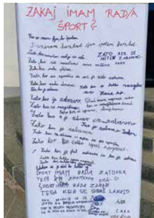
Mini olimpijada za učence od 1. do 5. razreda OŠ Laško in OŠ Debro

Dan slovenskega športa je tako še enkrat pokazal, kako pomembno je gibanje za