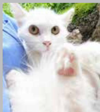
Nov dom išče tudi bel muc, star 6 mesecev, ki je veterinarsko oskrbljen.