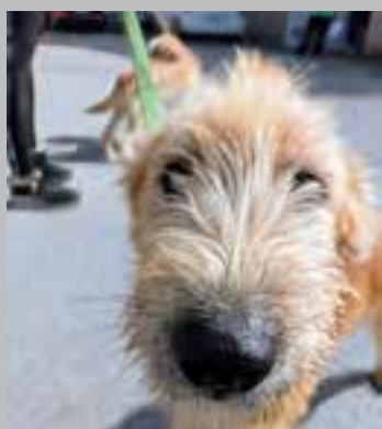
Pasja mladiča, stara 8 mesecev, sta prijazna in igriva.