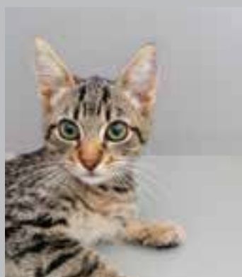
Tigrast mačji mladič je kastriran, cepljen in označen. Muc je igriv in prijazen.