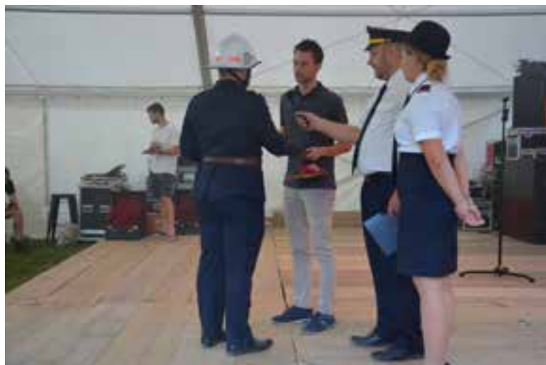
Župan je predal ključje novega vozila poveljniku PGD Jurklošter

Dogodek je bil lep prikaz povezanosti krajanov in gasilcev, ki s svojim prostovoljnim delom skrbijo za varnost v naši krajevni skupnosti. Dogajanje se je pričelo s slovesno parado gasilcev, kjer so sodelovali gasilci iz PGD Jurklošter in gasilci sosednjih društev.