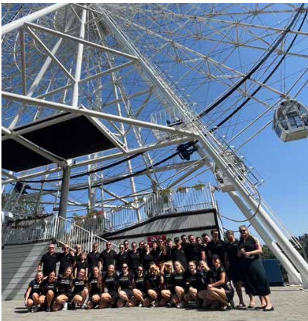
Najpogumnejši smo si Vrnjačko Banjo ogledali še z razglednega kolesa družine Golemić.

odpravili na »Pečenijado«, kjer smo preizkušali ponudbo njihovega »pečenja«, v večernem dogajanju pa s parado in nastopom popestrili kulturni utrip tega turističnega dogodka.